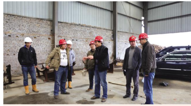
甲方代表在临港富强混凝土管桩调研。