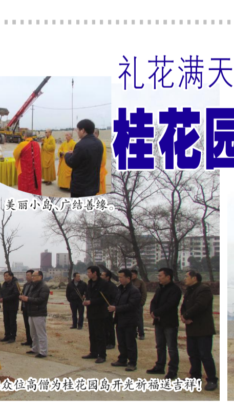
美丽小岛,广结善缘。