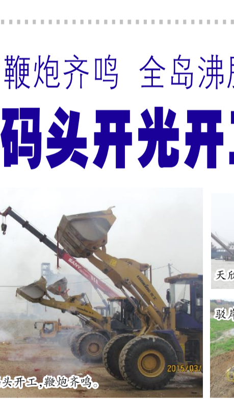
码头开工,鞭炮齐鸣。